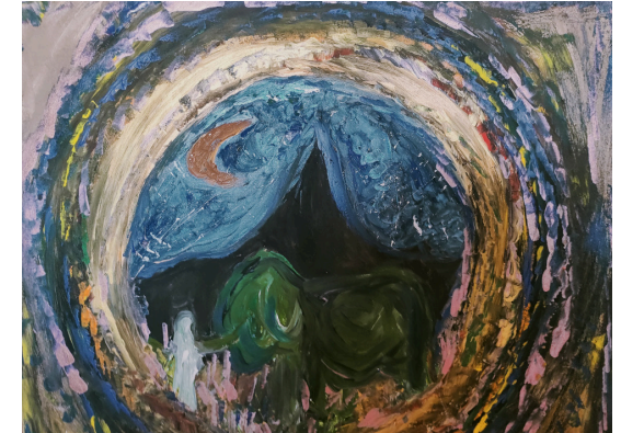
Isabell Gutierrez Liendo

Club 55 - für jedes Lebensalter - der Name geht zurück auf das erste Domizil Zasisusstraße 55